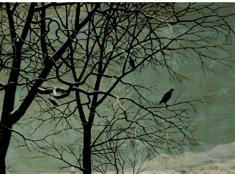
"Els caçadors en la neu", Brueghel (detall)

Això és el que han fet sempre poetes, pintors i artistes de totes les èpoques i països. La sessió conduïda per Pere Ballart i Montse Marsal plantejarà un recorregut per una tria de creacions que han posat l'hivern al centre, i el seu comentari oferirà arguments per descobrir que dins la natura i els cors, sota la neu i l'enyorança, també pot bategar "la saba del futur".